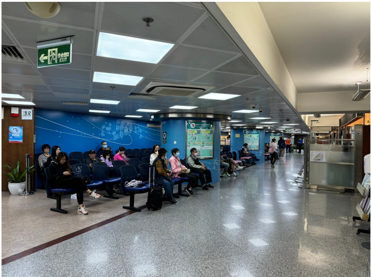
Bom funcionamento no primeiro dia do lançamento do novo BIR

Para mais informações, pode ligar para a linha aberta da DSI (2837-0777 ou 2837-0888), ou enviar email para info@dsi.gov.mo .