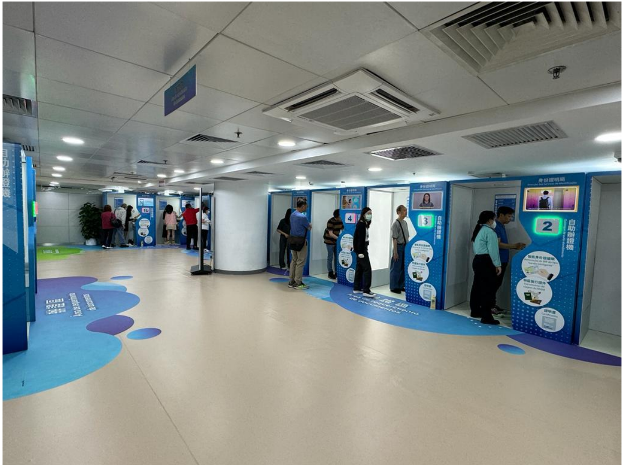
A deslocação dos residentes ao Centro de Serviços de Auto-Atendimento de 24 horas do Governo para tratamento de documentos encontra-se em boa ordem